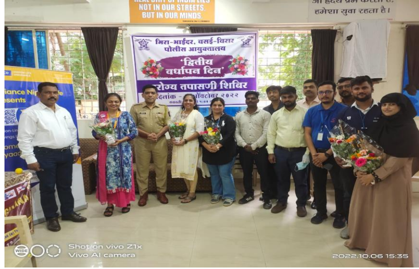
पोलीस आयुक्त कार्यालयामध्ये आयोजित आरोग्य शिबीरातील वैद्यकीय अधिकारी.