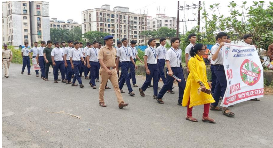
वालीव पोलीस ठाणे अंतर्गत आयोजित व्यसनमुक्ती जनजागृती रॅली.