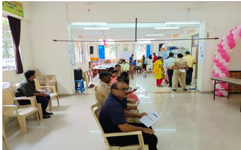
पोलीस आयुक्त कार्यालयामध्ये आयोजित आरोग्य शिबीर.

त्याचप्रमाणे वालीव पोलीस ठाणेमार्फत नायगांव परिसरामध्ये व्यसनमुक्ती जनजागृतीकरिता शाळकरी विद्यार्थ्यांसमवेत रॅली काढण्यात आली. व्यसनामुळे व्यक्तीच्या आरोग्यावर तसेच कौटुंबिक जीवनावर होणाऱ्या दुष्परिणामाबाबत सदर रॅलीदरम्यान बोर्ड तसेच घोषणेद्वारे जनजागृती करण्यात आली.