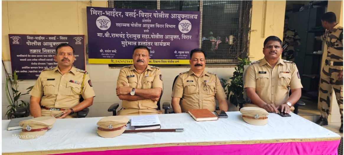
Metro City Samachar 10 May 2023 5:23 pm