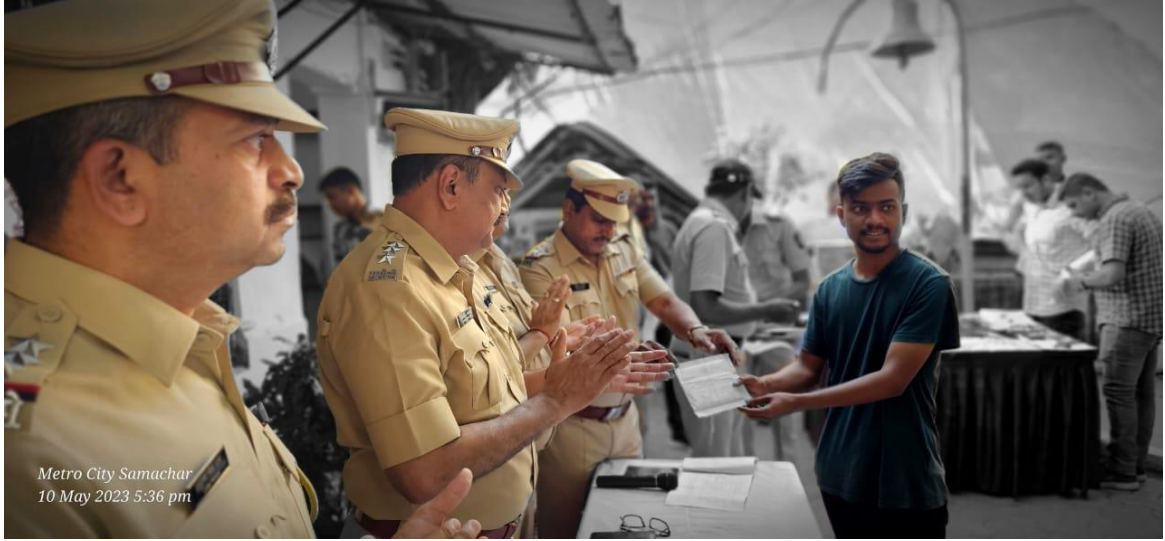
Metro City Samachar 10 May 2023 5:36 pm