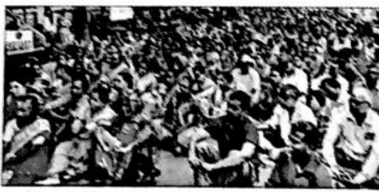
तहसूलदार कार्यालयावर काढण्यात आलेल्या मोर्चारील सहभागी आंदोलक आदिवासी

वार्ता: आदिवासी एकता परिषदेकडे वार्ताच्या भाषांत राहून असलेल्या आदिवासी बांधवांच्या विविध मागण्यांसाठी सोमवारी सकाळीं ११ वाजता तहसूलदार कार्यालयावर मोर्चा काढण्यात आला होता. यात शेकडो आदिवासी बांधव सामील झाले होते.