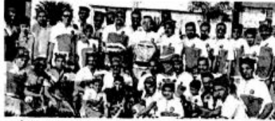
बसई : शिर्डीमध्ये कोंळीबांधवांनी वाढवण बंदराबाबत साईंना साकडे घातले.

गेली २६ वर्षे वाढवण बंदराविरोधात ग्रामस्थांचा लडा सुरू आहे. याबाबत आतापर्यंत सरकारकडे