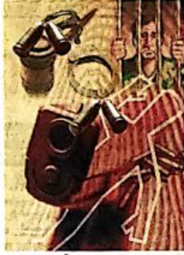
हत्येच्या घटना (२०२२)