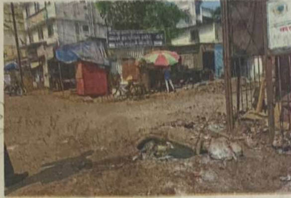
वसई : शहरातील उघडी गटारे धोकादायक ठरत आहेत.

वसई-विरार महापालिका क्षेत्रात उघड्या गटारांत पडून एका महिलेचा मृत्यू झाल्याची घटना घडली होती. यासंदर्भात याचिका दाखल करण्यात आली होती. या सुनावणीच्या वेळी सदर घटना न्यायालयाच्या निदर्शनास आणून देण्यात आली होती. त्यावर न्यायालयाने भूमिका स्पष्ट करत मॅनहोल मृत्यूचे सापळे नाहीत का, असा सवाल नुकताच मुंबईसह वसई-विरार शहर महापालिकेला विचारला आहे. त्यामुळे वसईतील मॅनहोलबाबत पुन्हा चर्चा सुरू झाली आहे. नागरिकांकडून तक्रार केल्यावर उपाययोजना केल्या जात असल्या तरी अनेक भाग दुर्लक्षित राहतात. अशा