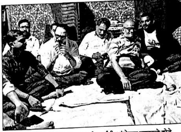
महाराष्ट्र एकीकरण समितीच्या कार्यकर्त्यांनी आंदोलन पुकारले होते.

महाराष्ट्र एकीकरण समितीचे १२ कार्यकर्ते पोलिसांच्या ताब्यात लोकसत्ता वार्ताहर