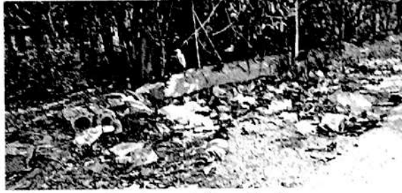
वसई : शहरात ठिकठिकाणी कचऱ्याचे ढीग साचले आहेत.

वसई-विरार शहरात दररोज ७०० मेट्रिक टन इतका कचरा निर्माण होत आहे. एकीकडे महापालिका प्रशासन शून्य कचरा मोहीम राबवणार, असे म्हणत असली तरी त्याला यश येत नसल्याचे दिसून येत आहे. त्यामुळे कचराभूमीला डोंगराचे स्वरूप आले आहे. आता या कचऱ्याची विल्हेवाट लावण्यासाठी २२५ कोटींचा प्रकल्प