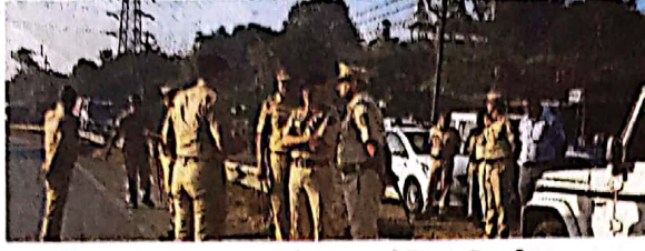
नालासोपारा : घटनास्थळावर पाहणी करताना पोलिस अधिकारी.