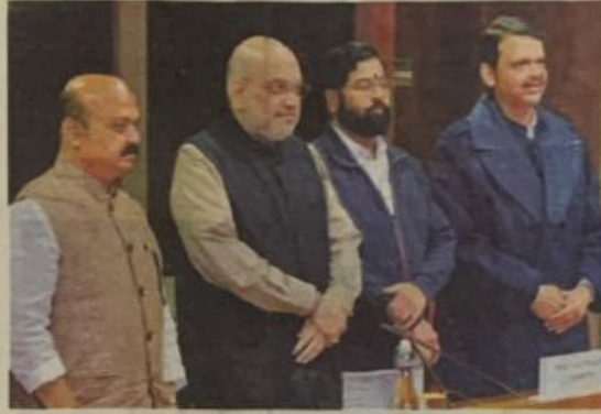
बैठकीवेळी केंद्रीय गृहमंत्री अमित शहा यांच्यासोबत कर्नाटकचे मुख्यमंत्री बसवराज बोम्मई, मुख्यमंत्री एकनाथ शिंदे आणि उपमुख्यमंत्री देवेंद्र फडणवीस.

बैठकीनंतर अमित शहा म्हणाले की, गृहविभागातील अधिकाऱ्यांच्या उपस्थितीत चांगल्या वातावरणात ही चर्चा झाली. दोन्ही राज्यांच्या वतीने प्रत्येकी तीन याप्रमाणे सहा मंत्र्यांमध्ये बैठक होईल. दोन्ही बाजूंकडील कायदा व सुव्यवस्थेची काळजी घेतली जावी. प्रवासी, व्यापारी यांना त्रास होऊ नये. यासाठी दोन्ही बाजूंनी आयपीएस अधिकारी नेमण्याची तयारी दाखविण्यात आली.