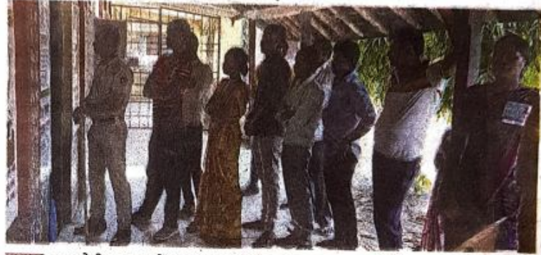
पालघर : वाडा येथील मतदान केंद्रावर मतदारांनी मोठ्या उत्साहात मतदान केले.

मुंबई, ता. १८ राज्यभरातील सात हजार १३५ ग्रामपंचायतींच्या सार्वत्रिक निवडणुकांसाठी प्राथमिक अंदाजानुसार आज सरासरी सुमारे ७४ टक्के मतदान झाले. यावेळी सदस्यपदांसह थेट सरपंचपदासाठीदेखील मतदान पार पडले. पालघर जिल्ह्यात ७८.६३, ठाण्यात ८०.३१, तर रायगडमध्ये ७९.२३ टक्के मतदान झाले. राज्य निवडणूक आयोगाने सात हजार ७५१ ग्रामपंचायतींच्या सार्वत्रिक निवडणुकांची घोषणा केली होती. त्यातील काही ठिकाणी सरपंचपदाच्या, तर काही ठिकाणी सदस्यपदाच्या निवडणुका बिनविरोध झाल्या. त्यामुळे आज प्रत्यक्षात ७,१३५ ग्रामपंचायतींसाठी सकाळी ७.३० ते सायंकाळी ५.३० या वेळेत मतदान झाले. नक्षलग्रस्त भागात दुपारी ३.३० वाजेपर्यंतच मतदानाची वेळ होती.