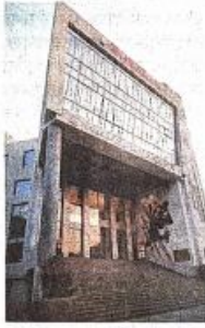
एकमेव असलेले लता मंगेशकर नाट्यगृह हे निविदा आणि कंत्राट न काढता खासगी ठेकेदाराच्या

हातात देण्याची तयारी महापालिका प्रशासनाने सुरू केली आहे. या घोरणाला भाजपने कडाडून विरोध केला आहे. मीरा-भाईंदर महापालिकेनेच हे नाट्यगृह चालवण्याची मागणी करण्यात आली आहे. विशेष म्हणजे जनतेच्या करातून बनवलेल्या सार्वजनिक मालमतेचा कारभार महापालिकेच्या वतीने खासगी कंत्राटदारांकडे सोपवण्यात येत आहे. यापूर्वी महापालिकेच्या वर्धमान फॅन्टसी पार्क (शिवार गार्डन), प्रमोद महाजन कम्युनिटी हॉल आणि मोनाताई टाकरे कम्युनिटी हॉल आणि मॅक्सिस मॉलसमोरील मैदान, स्पोर्ट्स