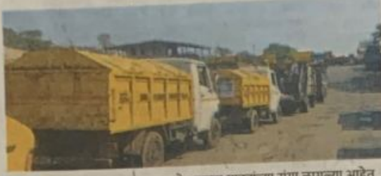
भाईदर : उत्तन घनकचरा प्रकल्पाबाहेर कचरा गाड्यांच्या रांगा लागल्या आहेत.

भाईदर, ता. २२ (बातमीदार) : मिरा-भाईदर महापालिकेच्या उत्तन येथील घनकचरा प्रकल्पात ओल्या व सुक्या कचऱ्यावर होणारी प्रक्रिया ठप्प झाली आहे. कचऱ्यावर प्रक्रिया करणाऱ्या कंत्राटदाराला महापालिकेकडून देयक न मिळाल्याने त्याने कचऱ्यावर प्रक्रिया करणे थांबवले आहे. परिणामी कचऱ्याने भरलेल्या गाड्या प्रकल्पाबाहेरच उभ्या राहिल्या आहेत. हीच परिस्थिती राहिली तर शहरात कचऱ्याचे ढोंग साचण्याची भीती व्यक्त होत आहे. शहरात दररोज निर्माण होणाऱ्या कचऱ्यावर उत्तनच्या धावणी येथील घनकचरा प्रकल्पात प्रक्रिया केली जाते, पण प्रक्रिया करणाऱ्या कंत्राटदाराचे गेल्या चार महिन्यांचे सुमारे सव्वा