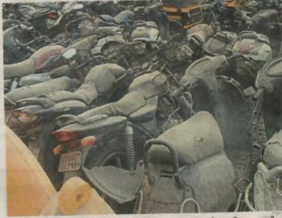
भाईदर : लक्ष्मीपार्क येथील जागा जप्त केलेल्या वाहनांसाठी अपुरी पडत आहे.