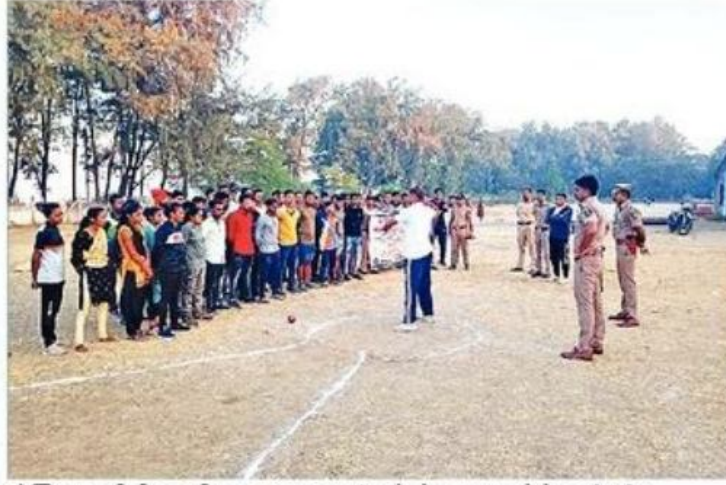
पोलिस भरतीची तयारी करणाऱ्या तरुणांना केले जात असलेले मार्गदर्शन.

१ ऑक्टोबर २०२० रोजी मीरा-भाईदर वसई-विरार पोलिस आयुक्तालयाची स्थापना करण्यात आली. तेव्हापासून शिपाईपदापासून ते वरिष्ठ अधिकार्यांपर्यंतच्या कर्मचाऱ्यांची कमतरता आहे. काही