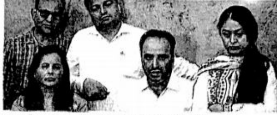
मुंबई : सिजानच्या कुटुंबीयांनी पत्रकार परिषद घेऊन आरोप फेटाळले.

आहेत. तुनिषाच्या हिजाब घातलेल्या छायाचित्राबद्दल त्या म्हणाल्या, 'हिजाब घातलेले तुनिषाचे छायाचित्र हे शूटिंगदरम्यानचे आहे. आम्ही तिला कधीही हिजाब घालायला लावला नाही. तुनिषाच्या आईने सिजानवर केलेला आरोप पूर्णपणे चुकीचा आहे. सिजान इस्सचे सेवन करत नव्हता. तुनिषाच्या आईने आमच्याविषयी गैरसमज पसरवले आहेत, असा आरोप सिजानच्या बहिणीने केला. सिजानच्या इतर मुलींशी असलेल्या संबंधांबद्दल बोलतात कुटुंबीयांनी त्याला तुनिषाशिवाय कोणतीही मैत्रीण नव्हती, त्याचे अनेक मुलींशी संबंध असल्याचे दावे छोटे असल्याचे सांगितले. सिजानच्या बहिणींनी केलेल्या दाव्यामुळे या प्रकरणाला नवीन वळण लागण्याची शक्यता आहे.