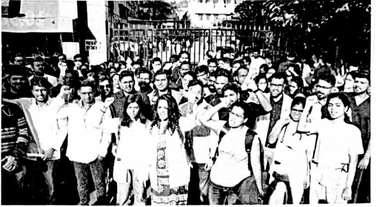
मुंबई : महापालिकेच्या नायर रुग्णालयाच्या निवासी डॉक्टरांनी बेमुदत संपात सहभागी होऊन आपला निषेध नोंदवला.