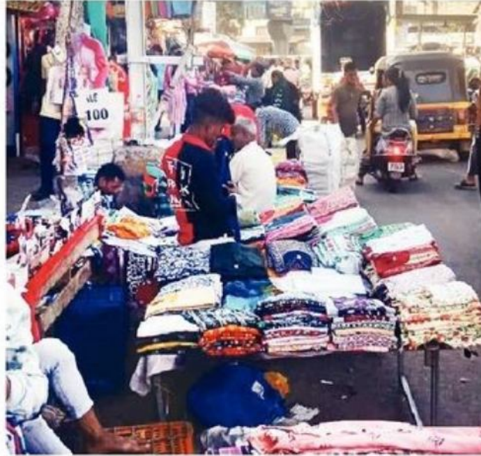
वसई-विरारमध्ये भर रस्त्यावरच फेरीवाले दुकाने मांडून बसतात.

सुट्टी, सणांच्या दिवशी फेरीवाल्यांचे रस्त्यावर बस्तान येत असल्याने पादचाऱ्यांना चालण्यासाठी अडचणीचा सामना करावा लागतो आहे. काही फेरीवाले रस्त्यावर आपले बस्तान रात्री उशिरापर्यंत ठेवत असल्याने वाहतूक कोंडी होत आहे. तुळीज पोलिसांनी रेल्वे स्थानक व गर्दीच्या परिसरातील फेरीवाले हटवण्यासाठी धडाकेबाज मोहीम सुरू केल्याने काही दिवस स्थानकाबाहेरचा परिसर फेरीवालामुक्त झाला होता. पण