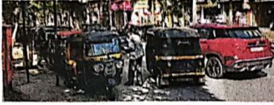
भाईदर : शहरात ठिकठिकाणी असलेल्या रिक्षा थांब्यांवर रिक्षांच्या दोन रांगा लावल्या जात असल्याने परिसरात वाहतूक कोंडी होत आहे.

प्रत्येकाला रोजीरोटी मिळाली पाहिजे यासाठी रिक्षा परवान्यांबाबत सरकारने उदार धोरण ठेवले आहे. परिणामी शहरात रिक्षांची संख्या वाढतच आहे. सध्या मिरा-भाईदरमध्ये सात ते आठ हजार रिक्षा धावत आहेत. शिवाय शहराबाहेरून येणाऱ्या रिक्षांची संख्या वेगळी आहे. या रिक्षांना उभे राहण्यासाठी स्वतंत्र जागा नसल्यामुळे शहरात ठिकठिकाणी सोयीनुसार रिक्षा थांबे तयार झाले आहेत. रिक्षा थांबे हे प्रादेशिक परिवहन विभाग, वाहतूक पोलिस व महानगरपालिका यांच्या समन्वयाने निर्माण करायचे असतात, पण मिरा-भाईदरमध्ये अनेक ठिकाणी कोणतीही परवानगी न घेता रिक्षा थांबे उभारण्यात आले आहेत. शिवाय प्रत्येक रिक्षा थांब्यावर किती रिक्षा उभ्या करण्याची परवानगी आहे,