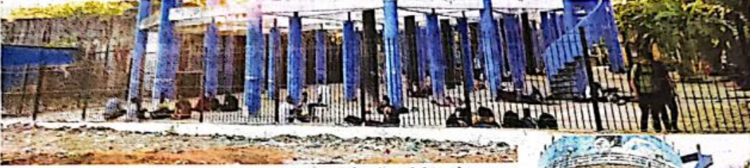
१० भाईदर पाण्याच्या टाकीखाली तसेच झाडेझुडपांमध्ये विभ्रंती घेणारी भरतीतील मुले

राहण्याची व्यवस्था नसल्याने भर थंडीत टाकीखाली काढावी लागली रात्र