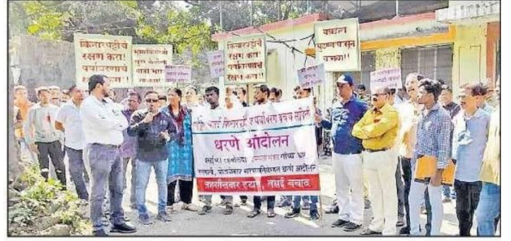
पर्यावरण वचाओ समिति की ओर से तहसीलदार कार्यालय के सामने भ्रष्टाचार समेत विभिन्न जन जमस्याओं को लेकर विरोध प्रदर्शन किया गया।