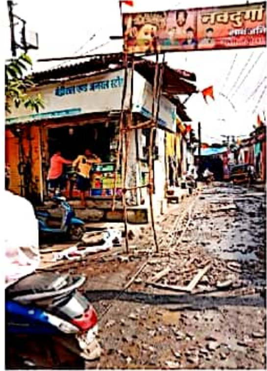
वसईत घाडत्या लोकवस्तीमुळे घाळीची बांधकामे मोठ्या संख्येने झालेली आहेत. वसई पूर्व भागातील स्थिती.

पावसाळ्यापूर्वी नाल्यांच्या सफाईसाठी नऊ प्रभागासाठी ठेके दिले जातात. मनपा शहरातील लहान, मोठे आणि गटारांची दरवर्षी करोडो रुपये खर्च करून सफाई करून घेते. नालासोपान्यातील काही परिसर दरवर्षी पूर्णतः पाण्याखाली असतो. त्यामुळे नालेसफाई न झाल्यामुळे पावसाळ्यात विविध साथीच्या आजाराना निमंत्रण मिळते व नागरिकांच्या आरोग्याचा प्रश्न निर्माण होतो, गाळ काढण्याचे कंत्राट ज्या ठेकेदाराला दिले जाते, तो वेळेवर काम पूर्ण करत नाही. अनेकदा नाल्यातून काढलेला गाळ बाजूला काढून ठेवतात, पण पावसामुळे तो गाळ परत नाल्यात जातो.