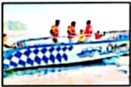
पर्यटकांसाठी सुविधा आवश्क

डहाणू किनाऱ्यावर पर्यटकांसाठी बोट सफर. पर्यटकांसाठी सुविधा आवश्क.