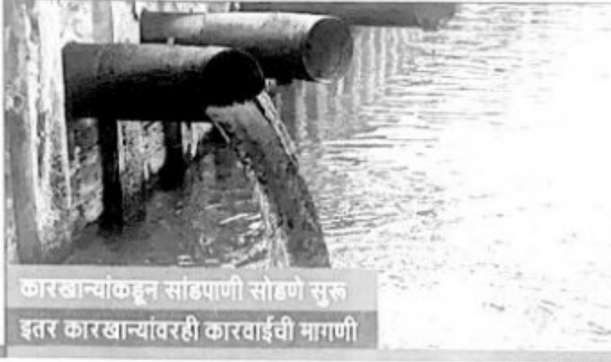
कारखान्यांकडून सांडपाणी सोडणे सुरू इतर कारखान्यांवरही कारवाईची मागणी

औद्योगिक वसाहतीमध्ये सांडपाणी वाहून जाण्याची योग्य व्यवस्था नाही. त्यामुळे कारखान्यांमधील सांडपाणी नैसर्गिक नाल्यांमध्ये बाराही महिने वाहताना दिसते. वसईतील औद्योगिक वसाहतीमधून तेलयुक्त पाणी उघड्यावर सोडण्याचे प्रकार नेहमीच घडतात. हे पाणी मटार्यांमधून नाल्याला आणि पुढे नद्या, खाड्यांना जाऊन मिळते. यामुळेच वसईतील अनेक खाड्या प्रदूषित झाल्या आहेत. त्यामुळे पर्यावरणप्रेमींनी संताप व्यक्त केला आहे. या कारखान्यांनी हे सांडपाणी प्रक्रिया करूनच बाहेर सोडावे, अशी मागणी पर्यावरणप्रेमींनी केली आहे.