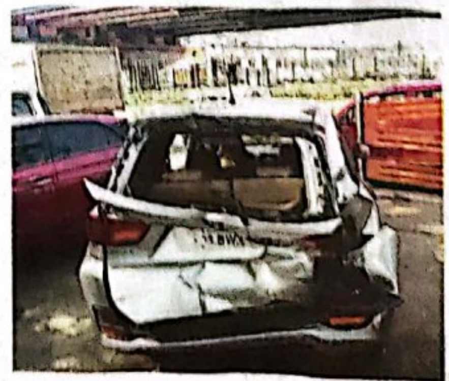
भाईदर : डॉ. सावंत यांची अपघातग्रस्त कार.