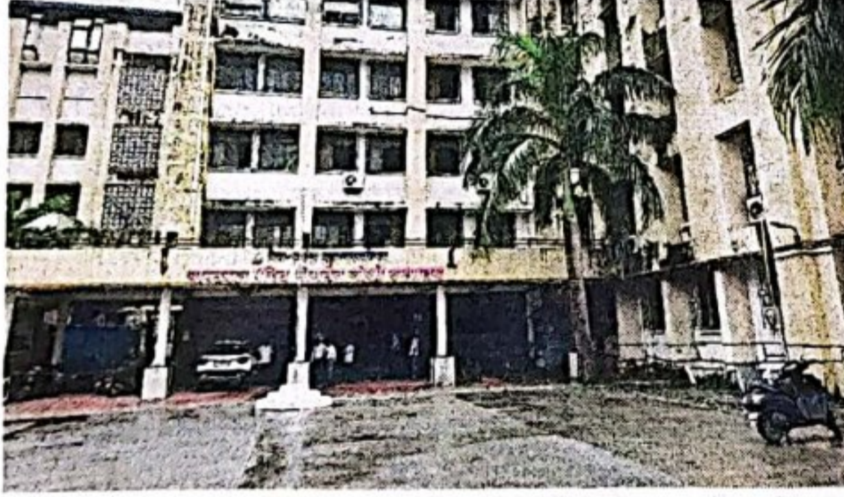
भाईदर : भारतरत्न पंडित भीमसेन जोशी रुग्णालयाची इमारत.

पंडित भीमसेन जोशी रुग्णालय हे सध्या राज्य सरकारच्या माध्यमातून चालविण्यात येत आहे. पण दोनशे खाटांच्या या रुग्णालयात आजही अत्याधुनिक आरोग्य सेवा नागरिकांसाठी उपलब्ध नाहीत. रुग्णालयात अनेक तज्ज्ञ डॉक्टरांची कमतरता आहे. रुग्णालयासाठी मंजूर असलेल्या डॉक्टरांसह अन्य पदापैकी केवळ पन्नास टक्के पदेच भरण्यात आली आहेत. रुग्णालयात काम करणारे डॉक्टर, परिचारिका तसेच