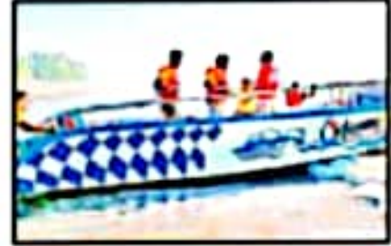
पर्यटकांसाठी सुविधा आवश्यक

डहाणू किनाऱ्यावर पर्यटकांसाठी बोट सफर. डहाणू किनाऱ्यावर पर्यटकांसाठी बोट सफर. डहाणू किनाऱ्यावर पर्यटकांसाठी बोट सफर.