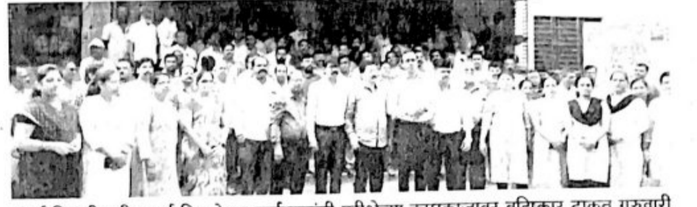
मुंबई विद्यापीठातील सर्व शिक्षकेतर कर्मचाऱ्यांनी परीक्षेच्या कामकाजावर बहिष्कार टाकत गुरुवारी सकाळी विद्यापीठ संकुलात आंदोलन केले.