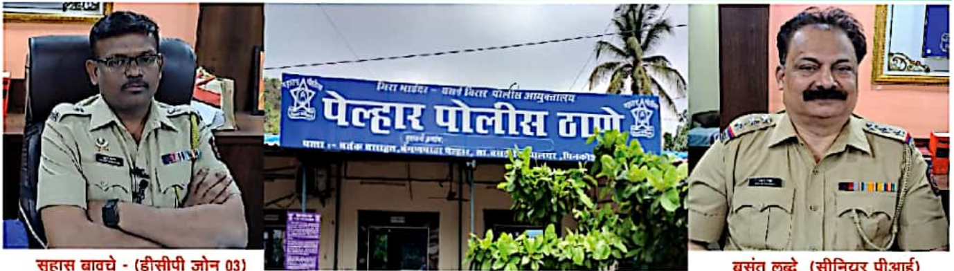
सुहास बावचे - (डीसीपी जोन 03)