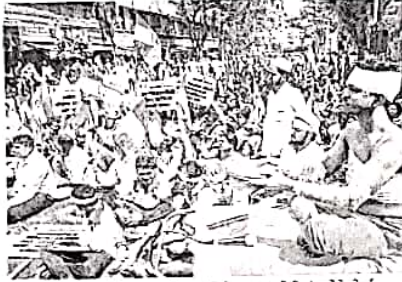
भाईदर : जोशी रुग्णालय खासगीकरणविरोधत श्रमजीवी संघटनेने मोर्चा काढला. यावेळी भोक मांगी आंदोलन करण्यात आले.

जोशी रुग्णालयाचा अवस्था दर्पनीय झाली असल्याने त्याचे खासगीकरण करण्याचा प्रस्ताव राज्य सरकारच्या विचाराधीन आहे. या प्रस्तावाला श्रमजीवी संघटनेने विरोध केला आहे. भोमसेन जोशी हे शहरातील एकमेव सरकारी रुग्णालय