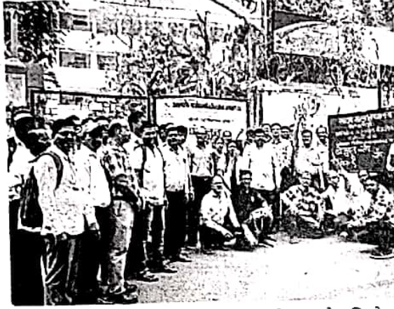
मुंबई : विलेपार्ले येथील साठवे महाविद्यालय प्रवेशद्वाराबाहेर शिक्षकेत्तर कर्मचाऱ्यांनी आंदोलन केले.

राज्यातील विद्यापीठ आणि महाविद्यालयांच्या कामकाजात शिक्षकेत्तर कर्मचारी संघटनांनी दिवसभर भाग घेतला नव्हता; मात्र सायंकाळी अधिकाऱ्यांकडून कामावर येण्यासाठी दबाव तंत्राचा वापर केल्याचे पदाधिकाऱ्यांनी सांगितले.