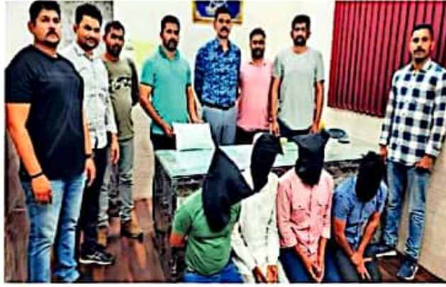
मागील वर्षी ४ डिसेंबरला गुन्हे शाखेच्या युनिट-३ ने व्हेल माश्याच्या उलटीची विक्री करण्यासाठी आलेल्या चार आरोपींना अटक केली होती.

व्हेल प्रजातीचे अनेक मासे समुद्रात आढळत असले तरीही 'स्पर्म' व्हेलच्या उलटीला परफ्यूम उद्योगात अतिशय महत्त्व आहे. यामुळे तिला भरमसाट दर