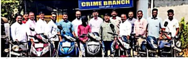
गुन्हे शाखेच्या युनिट-३ च्या पोलिसांनी वाहनचोरी व जवरी चोरी करणाऱ्या आरोपींना अटक करून आरोपींकडून नऊ गुन्हांची उकल करण्यात यश मिळवले आहे.