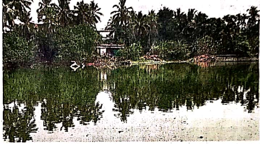
विरार : प्रभाग समिती 'ई' मधील नाळे तलावातील माशांचा चोरी होत आहे.

वसई-विरार महापालिकेचे नऊही प्रभागांत एकूण १०४ तलाव आहेत. यापैकी ५९ तलाव मत्स्यसंवर्धन आणि जतन यासाठी उपलब्ध करून देण्यात येणार होते. वसई-विरार महापालिका क्षेत्रातील मासेमारी संवटना आणि मच्छीमार संस्था यांना रोजगार उपलब्ध व्हावा, हा उद्देश या मागे होता. त्यानुसार वसई-विरार महापालिका प्रभाग समिती