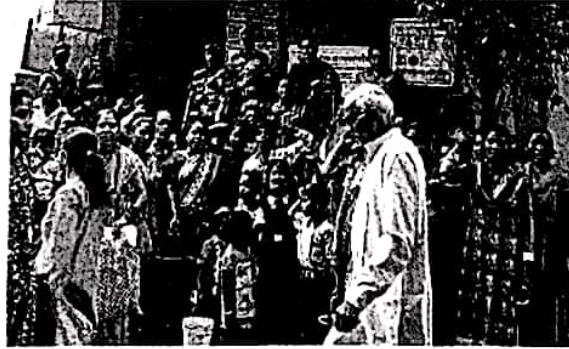
विरार : आदिवासी पाड्यांतील महिलांनी पालिकेवर 'टमरेल' मोर्चा काढला