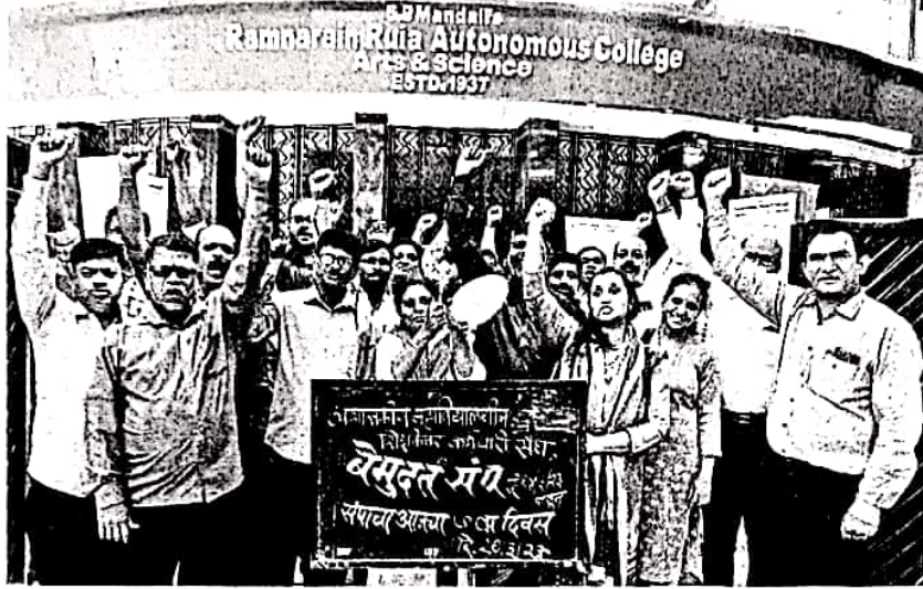
सर्वसामान्यांच्या कामांचा प्रश्न मिटला