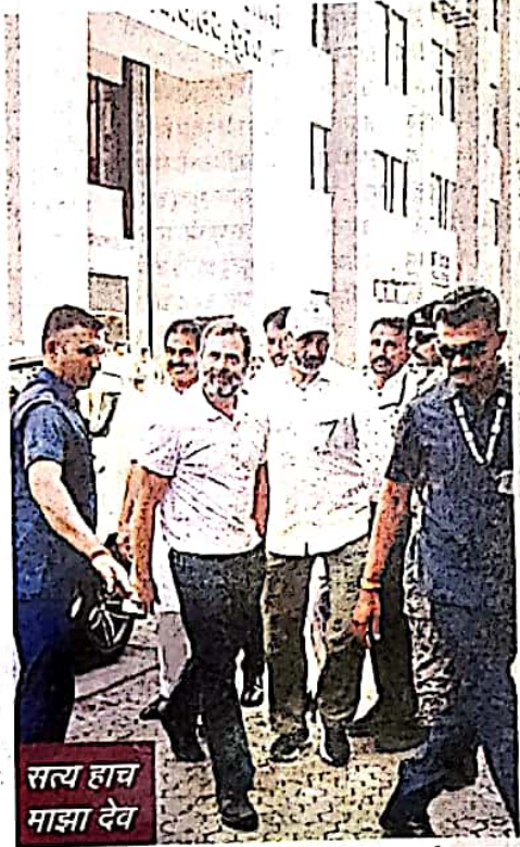
सत्य हाच माझा देव

काँग्रेस सरचिटणीस प्रियंका गांधी-वडेरा यांनी केंद्र सरकारवर जोरदार हल्लाबोल केला आहे. 'हे घाबरलेले सरकार साम, दाम, दंड आणि भेद वापरून राहुल गांधींचा आवाज दाबण्याचा प्रयत्न करत आहे. पण माझा भाऊ कधी घाबरला नाही आणि यापुढेही घाबरणार नाही. तो सत्य बोलत आला आहे आणि सत्य बोलतच राहणार. देशातील जनतेचा आवाज बुलंद करत राहू. कोट्यवधी देशवासीयांचे प्रेम राहुल गांधींच्या पाठीशी आहे', असे प्रियंका गांधींनी दिवटमध्ये म्हटले आहे.