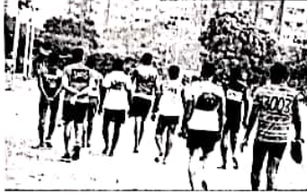
अहमदनगरच्या उमेदवारांचा मूल्य

मुंबई पोलिस दलातील ७,०७६ कॉन्स्टेबल पदासाठी सुमारे ५ लाख ८१ उमेदवार मैदानात उतरले आहे. ३१ जानेवारीपासून या पदांसाठी मैदानी चाचणी सुरू (पान १ व २)