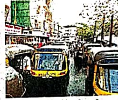
वाहतूकीला अडथळा ठरतोच तसेच पादचाऱ्यांना देखील तेथून ये-जा करणे त्रासदायक ठरते. त्यातच रिक्शा कशाही

गैरफायदा काही मुजोर रिक्शावाल्यांकडून घेतला जातो. ते मनमानी पद्धतीने रिक्शा कुठेही उभ्या करून तेथील वाहतूकीला अडथळा निर्माण करतात. तसेच शहरातील महत्वाच्या ठिकाणचे पदपथ अनधिकृत फेरीवाले तसेच दुकानदारांकडून व्यापले जात असल्याने दुकानासमोरच दुकानदारांची वाहने उभी केलेली असतात. त्या वाहनांच्या बाजूलाच रिक्शास्टॅण्ड निर्माण करून त्या उभ्या केल्या जात असल्याने त्यांचा