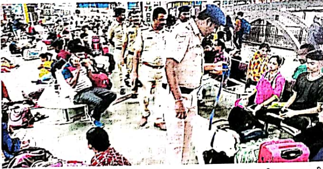
मुंबई : मुंबई, ठाण्यात रेल्वे स्थानकांसह गर्दीच्या ठिकाणी श्वानपथकांकडून तपासणी करण्यात आली. ठिकठिकाणी नाकेबंदी व गस्तही वाढवली गेली.