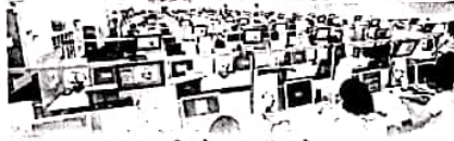
आणखी बोगस कॉल सेंटर?

एका आंतरराष्ट्रीय बँकेतील ग्राहकांची माहिती मिळवून त्यांची आर्थिक फसवणूक करणाऱ्या बोगस कॉल सेंटर उघड करण्यात अर्नाळा पोलिसांना नुकतेच यश आले आहे. कॉलसेंटरमध्ये काम करणाऱ्यांना ४९ जणांना पोलिसांनी अटक केली असून जास्त पगाराच्या नोकरीचे आमिष दाखवून त्यांना या कॉल सेंटरमध्ये काम करण्यास बोलावल्याचे तपासात निष्पन्न झाले आहे. आंतरराष्ट्रीय बँकेतील ग्राहकांना फसवण्यासाठी शिक्षण नव्हे, तर ईंग्रजी भाषा येणे महत्त्वाचे असल्याचे या कर्मचाऱ्यांना सांगण्यात आले होते. विशेष म्हणजे, आंतरराष्ट्रीय ग्राहकांचे कॉल बळवण्यासाठी विशिष्ट ऑप्लिकेशन किंवा बनावट संकेतस्थळ सुरू करण्यात आल्याचा संशयही पोलिसांनी व्यक्त केला आहे. अर्नाळा पोलिस ठाण्याच्या हद्दीत