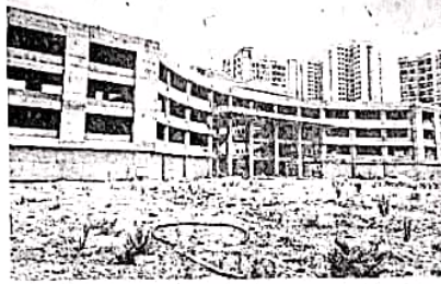
वसई : विरार येथे उभारण्यात येणारे राष्ट्रीय क्रीडासंकुल अपूर्णावस्थेत आहे.

मात्र २०१८ रोजीच्या कार्यदिशात १८ महिन्यांत म्हणजेच जुलै २०१९ पर्यंत क्रीडासंकुलाचे काम पूर्ण करण्याची अट घातली गेली होती,