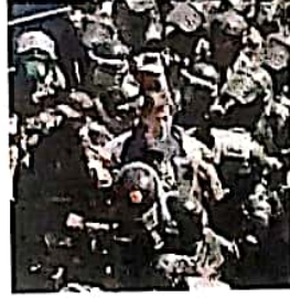
निमलष्करी जवानांच्या गराड्यात इम्रान खान.

पाकिस्तानी लष्कराने माझी हत्या करण्याचा कट आखला आहे, असा गंभीर आरोप इम्रान यांनी सोमवारी केला होता. त्यानंतर लगेचच मंगळवारी ७० वर्षीय इम्रान यांना जमीन व्यवहार प्रकरणात अटक झाल्याने देशातील राजकीय वातावरण ढवळून निघाले आहे. आयएसआयच्या वरिष्ठ अधिकाऱ्यावर इम्रान यांनी केलेले आरोप हे विनबुडाचे आहेत, असे पाकिस्तानी लष्कराने सोमवारी म्हटले