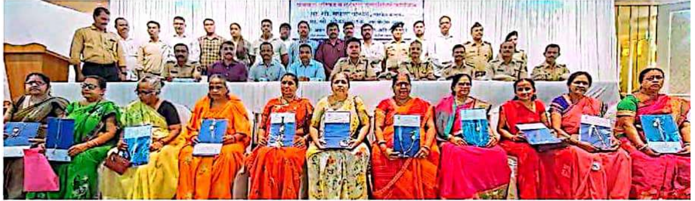
भाईंदर : मार्चमध्ये मिरा रोड येथील कार्यक्रमात महिलांचे दागिने चोरीला गेले होते. दोन महिन्यांच्या तपासानंतर हे दागिने जप्त करत महिलांना सुपूर्द करण्यात आले.

१८ व १९ मार्चदरम्यान मिरा ड येथील एस. के. स्टोन पोलिस ाकीच्या मागे असलेल्या मोकळ्या दानात बागेश्वरधाम सरकार यांच्या वचनाचा कार्यक्रम आयोजित रण्यात आला होता. या कार्यक्रमाला खो भक्त आल्याने मोठी गर्दी सळली होती. गर्दीचा फायदा घेत ोरट्यांनी ६० महिला आणि एक रुप यांचे सुमारे ९९० ग्रॅम वजनाचे