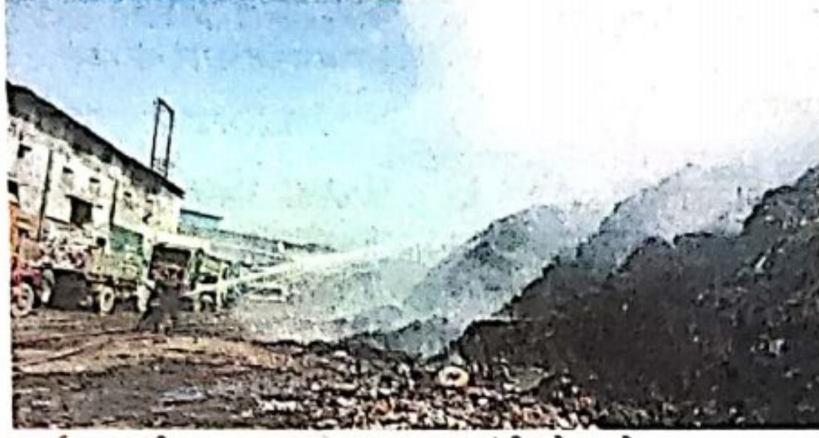
वसई : शहरातील कचरा व्यवस्थापनाचा प्रश्न गंभीर होत आहे.

वसई, ता. २१ (बातमीदार) : वसई विरार महापालिकेने शहरात 'मेरी लाईफ, मेरा स्वच्छ शहर' हा केंद्र सरकारचा उपक्रम राबवण्यासाठी कंबर कसली आहे; परंतु वर्षभर साचलेला कचरा, क्षेपणभूमीवरील कचऱ्याची शास्त्रोक्त पद्धतीने विल्हेवाट लावण्यात अद्यापही यश आले नाही. महापालिकेला हरित लवादाने १७० कोटी रुपयांचा दंड भरण्याचा आदेशदेखील दिला असून कारवाईचे संकेत दिले आहेत. शहरातील कचरा विल्हेवाटीचा प्रश्न गंभीर आहे. महापालिकेने सौंदर्यीकरण उपक्रम राबवल्यानंतरही कचऱ्याची समस्या जैसे थे असल्याचे चित्र आहे.