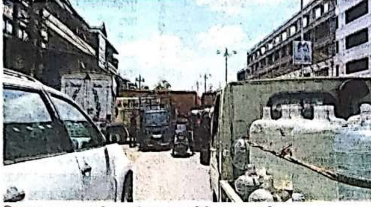
विरार : अवजड वाहनांमुळे शहरातील वाहतूक कोंडीत भर पडत आहे.