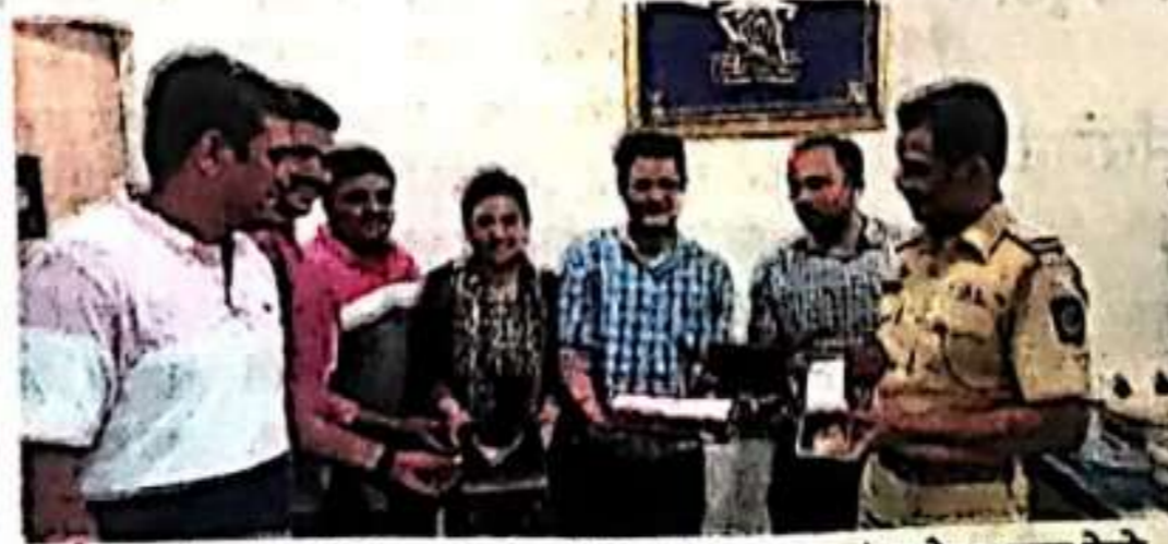
भाईदर : सोन्याचे दागिने काशी-मिरा पोलिसांनी पाच तासांत शोधून परत केले.

काशी-मिरा येथील माशाचा पाडा परिसरात राहणारे कुटुंब रिक्षेने बोरीवलीला जात होते. सामानाची एक बॅग त्यांनी रिक्षाच्या सीटच्या मागच्या भागात ठेवली. त्या बॅगमध्ये सुमारे १२ लाखांचे सोन्याचे दागिने