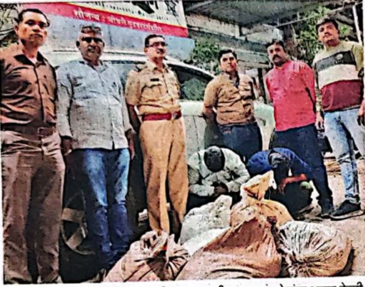
हातभट्टीच्या दारूची भिंबंडीतून भाईदरला तस्करी करणाऱ्या दोघांना अटक केली.