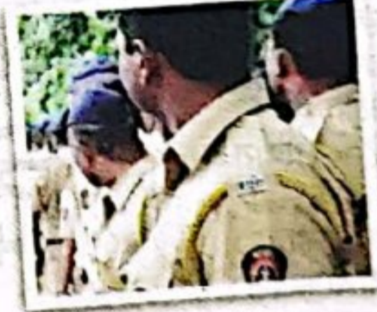
- पोलिस प्रशासन

मीरा-भाईदर, वसई-विरार शहरांत सार्वजनिक होळी व खासगी होलिकोत्सवाचे आयोजन करण्यात आलेले आहे. होळीसह धूलिवंदनाच्या दिवशी कायदा व सुव्यवस्थेचा प्रश्न निर्माण होऊ नये, याकरिता पोलिस दल सतर्क आहे. कुठेही अनुचित प्रकार घडू नये, तसेच सणाला गालबोट लागू नये, याची दक्षता घेतली जाणार आहे.