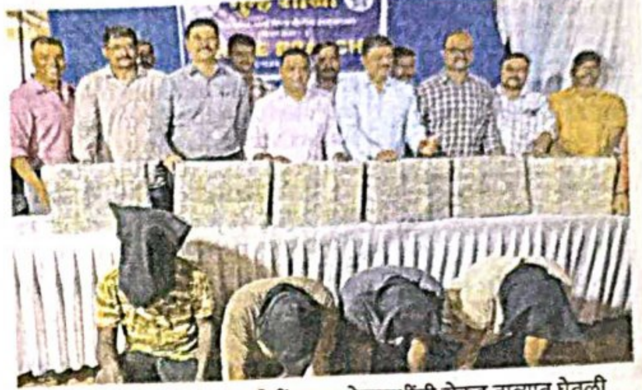
विरार : पोलिसांनी संशयित आरोपींकडून कोट्यवधींची रोकड ताब्यात घेतली.

स्वामी यानेच आरोपींना रोख रक्कम घेऊन निघाल्याची माहिती दिली