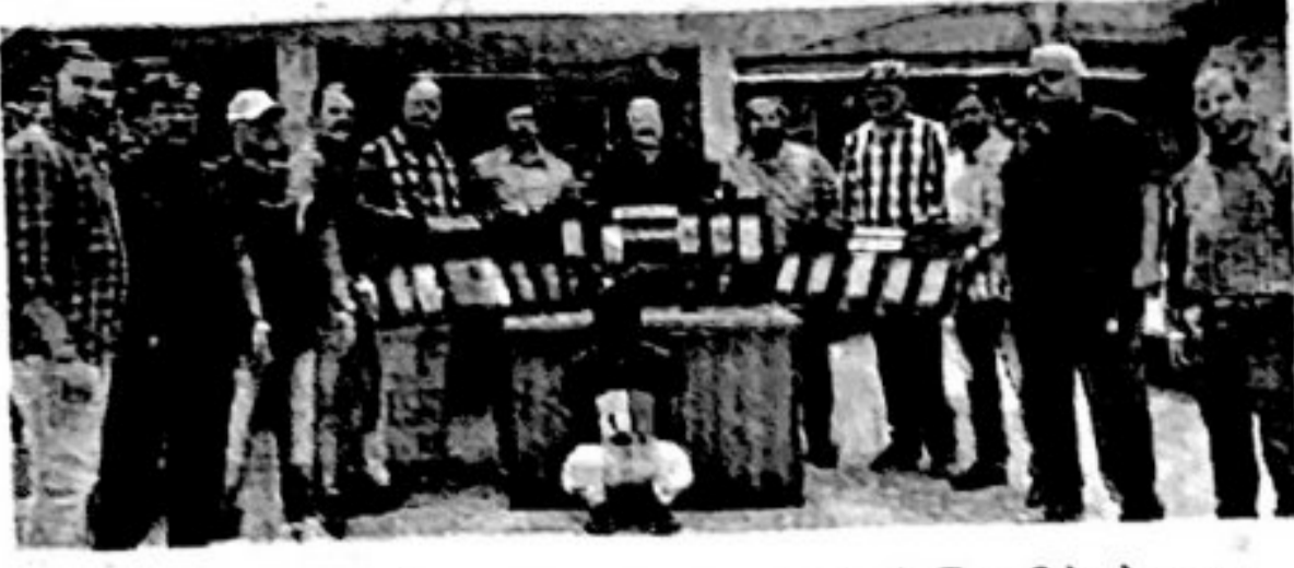
भाईदरमधील दुकान फोडून १६ लाख ७९ हजार रुपये किमतीचे मोबाइल चोरणाऱ्या आरोपीला मीरा-भाईदर गुन्हे शाखेने दिल्लीतून अटक केली आहे.