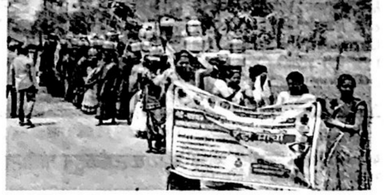
श्रमजीवीने वसई तालुक्यात ग्रामपंचायतींवर हंडा मोर्चा काढला.

गावांत जलजीवन मिशनअंतर्गत हर घर जल देण्याचा कार्यक्रम सुरू आहे. ४ सप्टेंबर २०२० च्या शासन निर्णयानुसार प्रत्येक गावातील सर्व कुटुंबांतील घरांत नळाने पाणीपुरवठा मिळालेच पाहिजे, अशी योजना आहे. त्यासाठी केंद्र आणि राज्य शासनाने कोट्यवधी रुपयांची तरतूद केली आहे. १५व्या वित्त आयोग व पेसामधून हा पाणीपुरवठ्यासाठी खर्च होणार आहे. या योजनेसाठी निधीची कमतरता नसताना योजना पूर्ण करण्याची मुदत संपली आहे. अजूनही अनेक गावांमध्ये सर्व घरांना, झोपड्यांना गावात नळाने पाणीपुरवठा झालेला नाही.