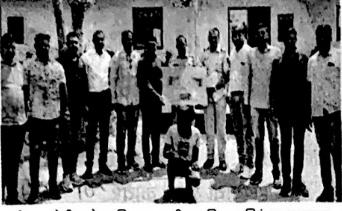
वसई फाटा येथील ओव्हर ब्रिजच्या खाली एक पिस्तूल, जिवंत काडतुसासह एका आरोपीला पेल्हार पोलिसांनी रविवारी सायंकाळी अटक केली.