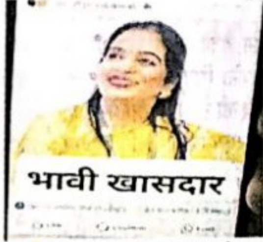
भाईदर : समाजमाध्यमावर आलेल्या पोस्टचा फोटो.

भाजप व शिवसेनेत जोरदार रस्सीखेच सुरू आहे. भाजपकडून माजी खासदार डॉ. संजीव नाईक यांचे नाव सर्वांत पुढे