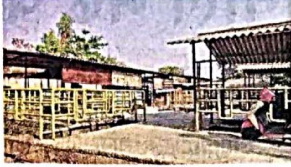
ग्लोबल सिटी येथील सांडपाणी पुनर्प्रक्रिया केंद्र.

■ मॅनहोलमध्ये काम करणे प्रतिबंधित असतानाही अशा प्रकारच्या घटना अद्यापही घडत असल्याचे दिसत आहे.