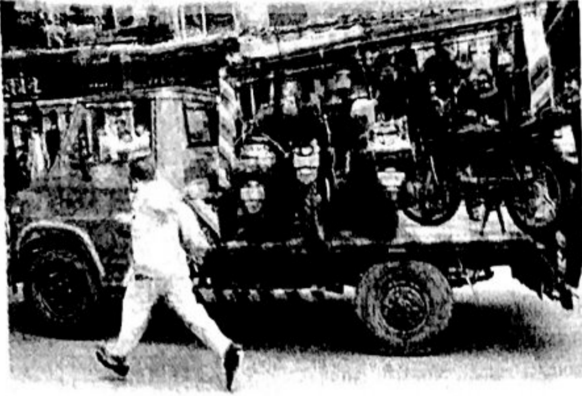
वाहने उचलून नेताना वाहतूक विभागाचे अधिकारी, कर्मचारी.