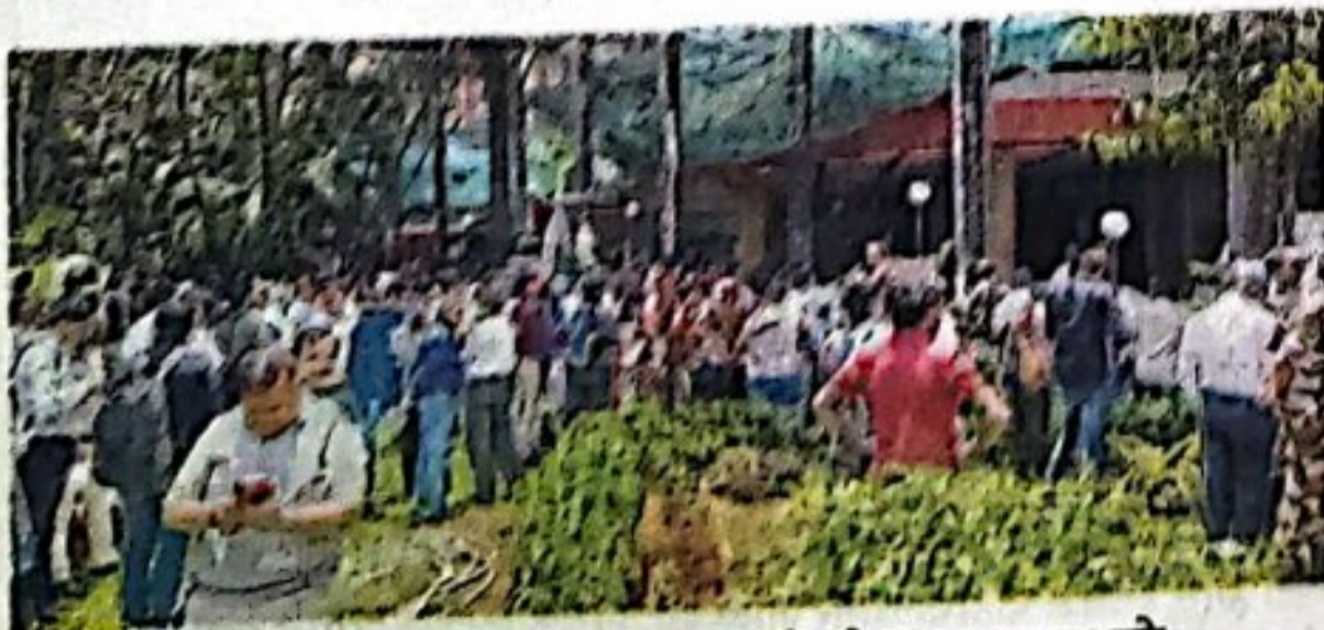
भाईदर : मॉक ड्रिलदरम्यान नागरिकांना इमारतीबाहेर काढण्यात आले.

पडण्यात कर्मचाऱ्यांना अडथळा होत होता. शिवाय पहिल्या मजल्यावरही जिऱ्याच्या दिशेने जाणाऱ्या मोकळ्या भागात कार्यालये आहेत. त्यामुळे कर्मचाऱ्यांना इमारतीबाहेर पडण्यास विलंब झाला. अग्निशमन दलाने सात मिनिटांत मुख्यालयाची इमारत रिकामी केली, मात्र ही इमारत चार मिनिटांत रिकामी होणे आवश्यक आहे.