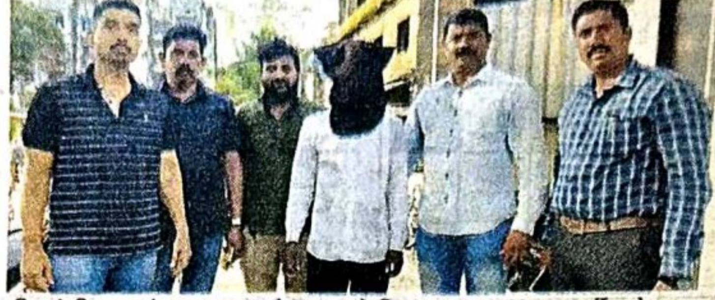
तीन गंभीर गुन्ह्यांत फरार असलेल्या आरोपीला पकडण्यात मध्यवर्ती गुन्हे प्रकटीकरण शाखेच्या पोलिसांनी यश मिळवले आहे.