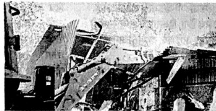
विरार : महापालिकेकडून अतिक्रमण हटवण्यात आले.

प्रभाग समिती 'जी' वालीव परिसरातील लक्ष्मी इंडस्ट्रीजमार्गे अंदाजे पाच हजार चौरस फूट अनधिकृत बांधकाम तोडण्यात आले. कामण खिंडीपाडा येथे अंदाजे साडेसहा हजार चौरस फूट अनधिकृत बांधकाम तोडण्यात