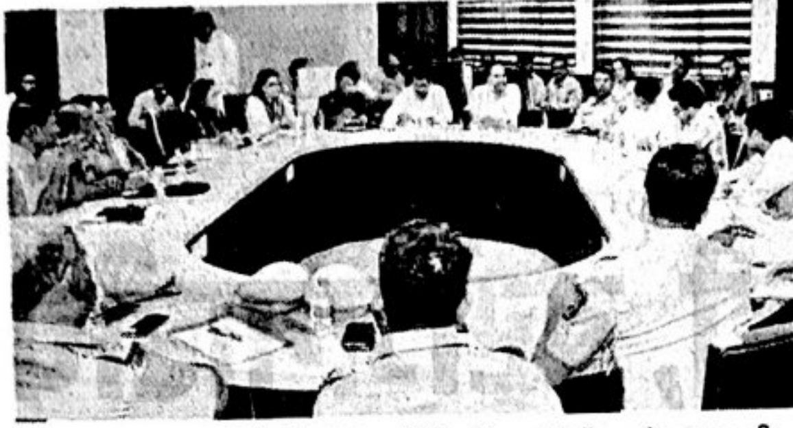
मीरा-भाईंदर महापालिकेने पोलिसांसह विविध विभागांची बैठक घेऊन आपत्ती व्यवस्थापनाबाबत चर्चा करून योग्य उपाययोजना करण्याच्या सूचना दिल्या.