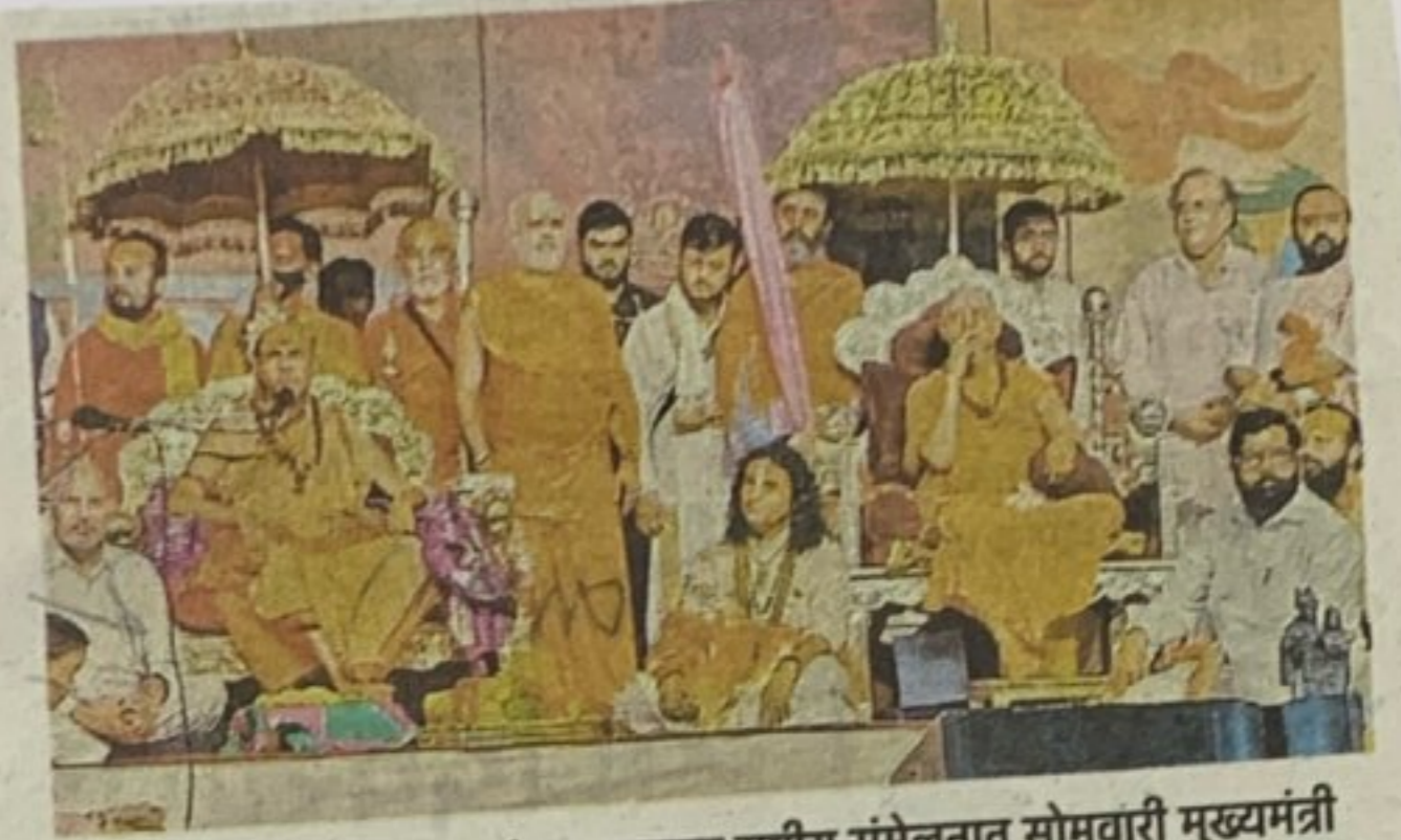
भाईदर येथील भागवत सत्संग व सनातन राष्ट्रीय संमेलनात सोमवारी मुख्यमंत्री एकनाथ शिंदे यांनी उपस्थित स्वामींचे आशीर्वाद घेतले.

कॉइनचे महत्त्व सांगत एका खोलीत तोंडावर मास्क व हातात ग्लोव्हज घालून लोकांना दूर उभे करून तांब्याचे कॉइन दाखवत. त्यावर रसायन, ग्लिसरीन पावडर, मुलतानी माती, लाल रंगाची पॅरामॅग्नेशन पावडर, निळ्या रंगाची कॉपर सल्फेट पावडर, ऑइल असे वापरत. केमिकल खूप स्ट्रॉंग आहे, त्यामुळे कॅन्सर होऊ शकतो, असे सांगत खाली लोहचुंबक ठेऊन मग त्यावर कापूस ठेवत रासायनिक प्रक्रिया केलेले तांब्याचे नाणे ठेवत. मग धाग्यात सुई घालून ती नाण्यावर धरली की खाली लपवून ठेवलेल्या लोहचुंबकामुळे ती सुई ६० डिग्री फिरत असे. सुई ९० डिग्री फिरल्यावर कॉइन परिपूर्ण होणार, असे सांगून त्यासाठीही पैसे मागितले जात होते.