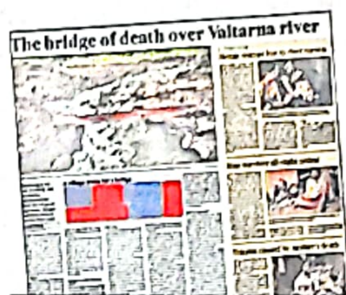
SEPT 17, 2024: HT report on how villagers live in peril as eight people drowned by Vaitarna dam waters in three years