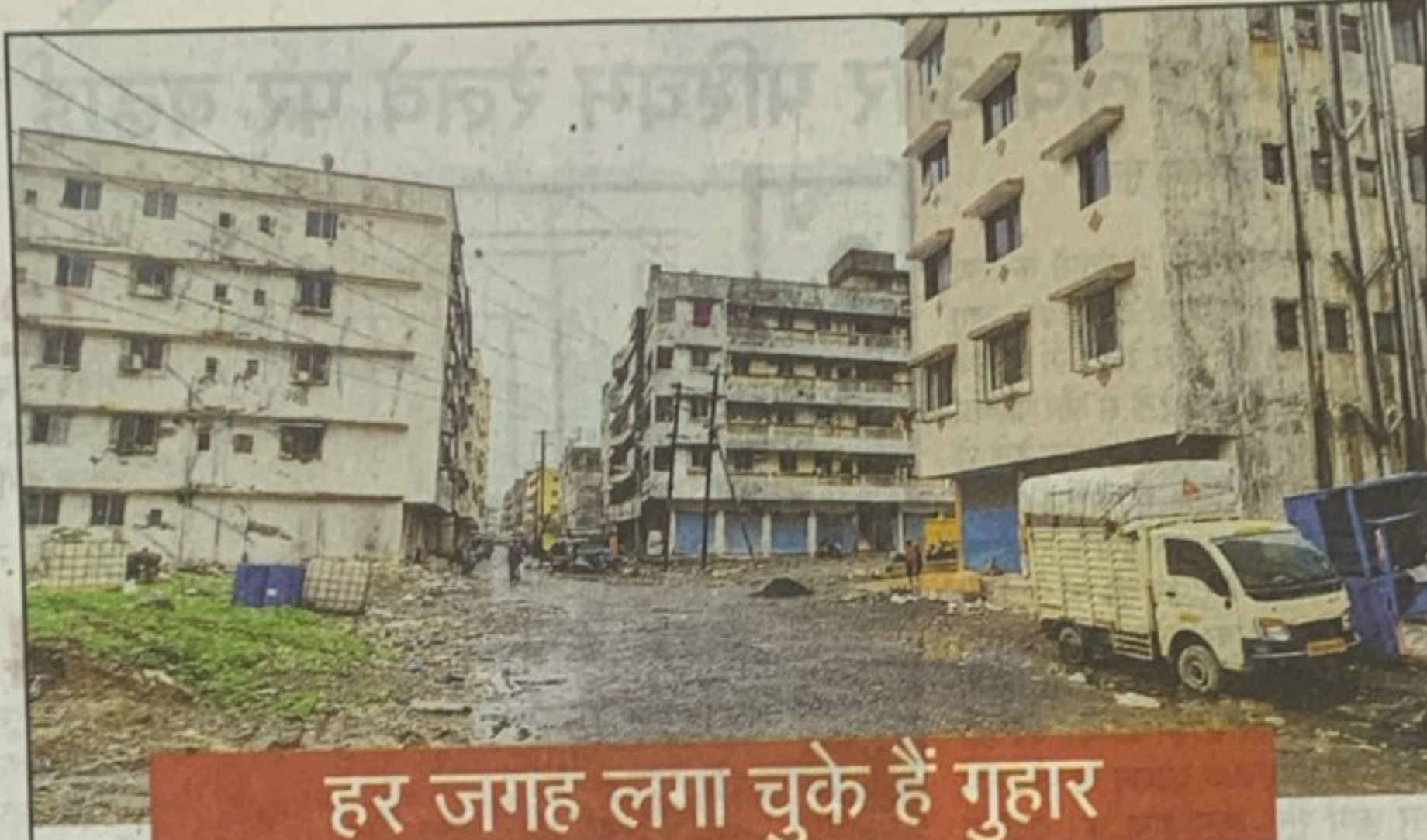
हर जगह लगा चुके हैं गुहार