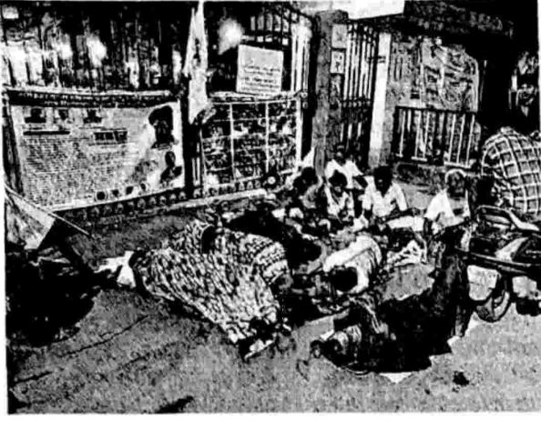
प्रहार दिव्यांग संघटनेने केले तीन दिवस मीरा-भाईदर महापालिका मुख्यालयाच्या प्रवेशद्वारावर अशा प्रकारे निषेध आंदोलन चालवले आहे.