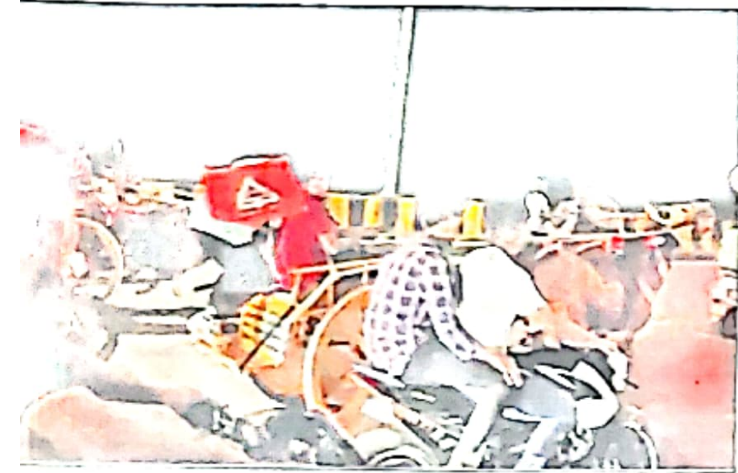
A video captured by a motorist shows the accused mercilessly whipping the horses with canes to make them run faster.