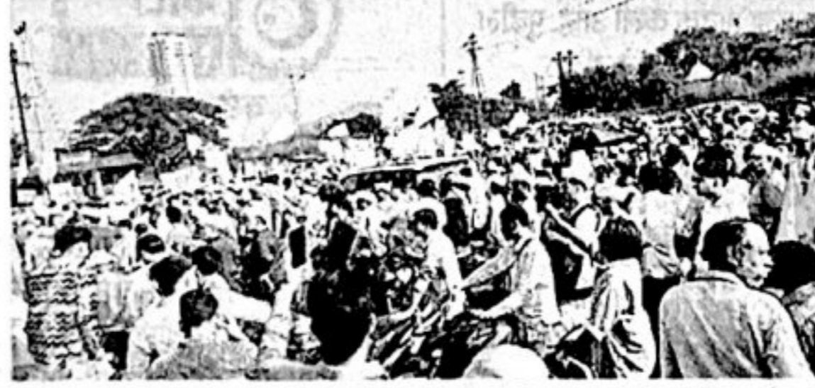
अग्रवाल परिसरातील ४९ इमारतींच्या रहिवाशांनी मंगळवारी दुपारी वसई-विरार मनपाच्या मुख्य कार्यालयावर मोठा मोर्चा काढला होता.